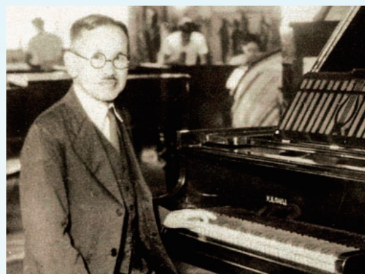
1927年 河合小市は河合楽器研究所を創立