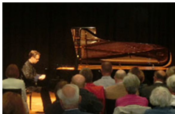
ヨーロッパ・カワイコンサート (クレフェルト市 カンブスホール)

これまでに220回以上のコンサートを開催しております。また、著名ピアニストを招聘してピアノマスタークラスを主催するなど、様々な文化事業を行ってきました。浜松市とクレフェルト市との文化交流においても支援を行っております。