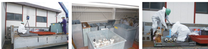
高濃度PCB廃棄物の搬出

河合楽器製作所本社、研修センター、竜洋工場、カワイハイパーウッドに保管していました高濃度PCB廃棄物34台をJESCO（中間貯蔵・環境安全事業株式会社 JAPAN ENVIRONMENTAL STORAGE & SAFETY CORPORATION）の豊田事業所に委託して適切に処理しました。