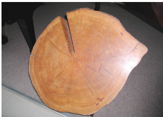
スプルース(マツ科トウヒ属)の断面 ピアノ響板に使用、樹齢 250～260年

高品質で貴重な木材を多く使用する楽器メーカーとして、木材を生み出す森林の保護、育成、保全は特に重要と考え、生物多様性の保全に配慮した木材の調達に取り組んでいます。