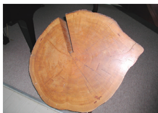
スプルース（マツ科トウヒ属）の断面 ピアノ響板に使用、樹齢 250～260 年

高品質で貴重な木材を多く使用する楽器メーカーとして、木材を生み出す森林の保護、育成、保全は特に重要と考え、生物多様性の保全に配慮した木材の調達に取り組んでいます。