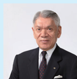
代表取締役会長兼社長

このようなことを踏まえ、私は、今回ここに業務の遂行にあたり、役員以下カワイグループ全社員に率先して当社のもつ社会的責任を自覚し、あらゆる場面において「カワイ倫理規範」を遵守し、「倫理行動規程」の精神に則って行動することを誓います。