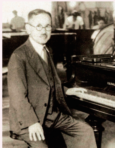
1927年 河合小市は7人の技術者とともに河合楽器研究所を創立しました