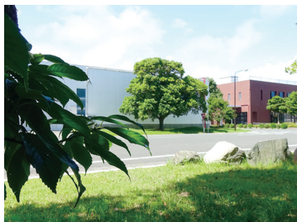
「森の中の緑の工房」竜洋工場

秋には磐田市内の子ども園の園児たちが工場を訪れ、どんぐり拾いをおこない、その実を工作あそびに使用してもらうなど竜洋工場の「森」を活用した地域貢献も行っていきます。