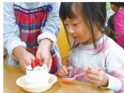
どんぐりを飾ったケーキのおもちゃ