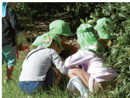
どんぐりを拾う園児たち