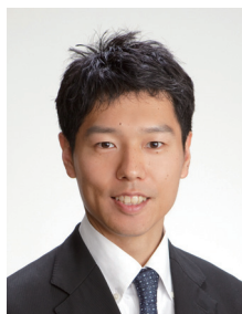
チーフアドバイザー 水鳥 寿思 さん

2004年アテネオリンピック体操男子団体総合金メダリスト。現役を引退後カワイ体育教室のチーフアドバイザーに就任しました。各地区での講話や実技披露など、運動の楽しさを広めるとともに、幼児・児童の体力強化や大人の健康増進に向けた運動プログラムの監修にもあたっています。