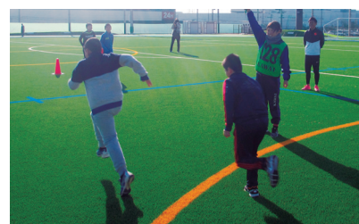
ランニングフェスティバルでの指導

カワイ体育教室では走ることに限らず運動することの楽しさを味わえる教室展開をしております。