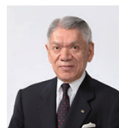
代表取締役会長兼社長

このようなことを踏まえ、私は、今回ここに業務の遂行にあたり、役員以下カワイグループ全社員に率先して当社のもつ社会的責任を自覚し、あらゆる場面において「カワイ倫理規範」を遵守し、「倫理行動規準」の精神に則って行動することを誓います。