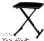
〈イス〉 WB-6 6,300円