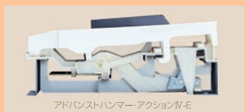
アドバンスドハンマーアクションIV-E

●フォルテシモのしっかりした手ごたえ感と、ピアノシモの微妙なコントロール感を両立、心地よいタッチ感を実現したAHA IV-E型鍵盤を搭載しました。