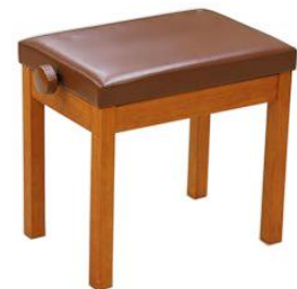
カワイ「木製高低自在椅子 WB-191」

尚、ご連絡いただきました後、お客様宅をご訪問するまでに数日を要する場合がございます。ご訪問までのご使用につきましては、安全のため、椅子の座の高さを最も低くしてご使用いただきますようお願い申し上げます。