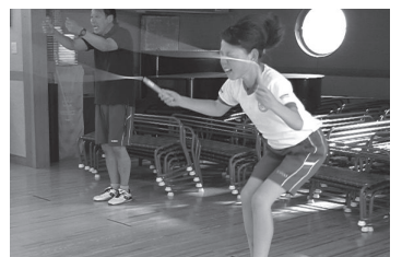
チャレンジコース